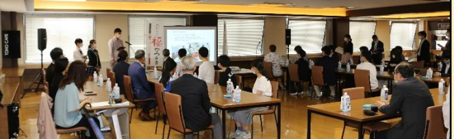
福島市長、JR福島駅長、福島大学 学長などが出席